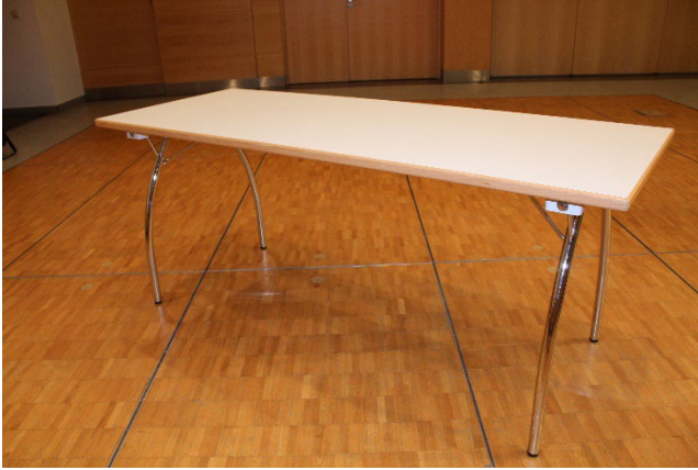
Tables pied chrome 1.80 x 0.7m max. 6 personnes sur 1 table