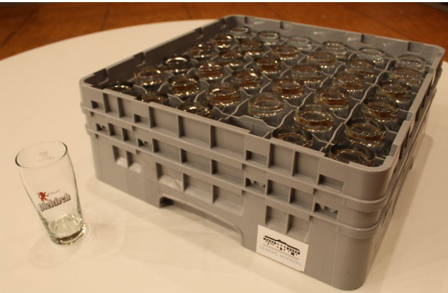
Verres à bière (432 pièces)