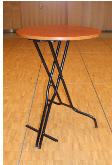
Tables hautes (pied noir) H 110 cm Ø 80 cm