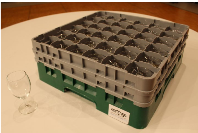
Verres à vin (216 pièces)