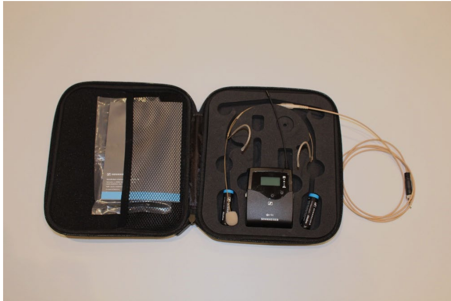
Micro pour fixer à la veste / Headset (technicien de son recommandé!)