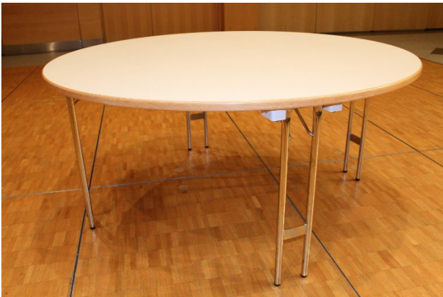
Tables rondes \varnothing 1.60m max. 8 personnes sur 1 table