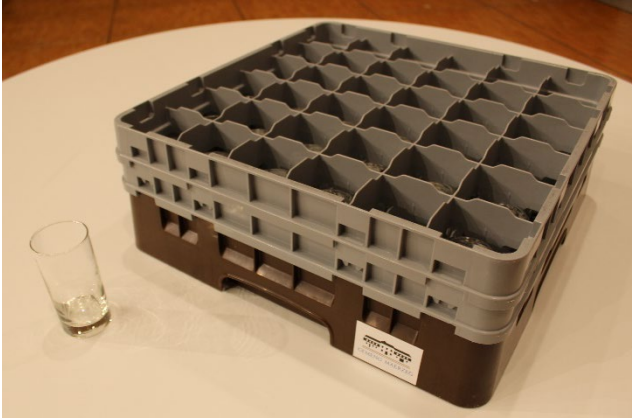
Verres (216 pièces)