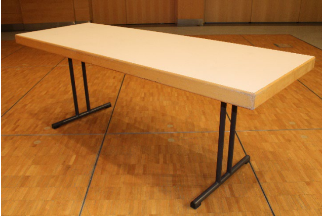
Tables pied noir 2.00 x 0.7m max. 8 personnes sur 1 table