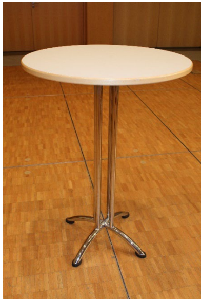
Tables hautes (pied chrome) H 110 cm Ø 80 cm