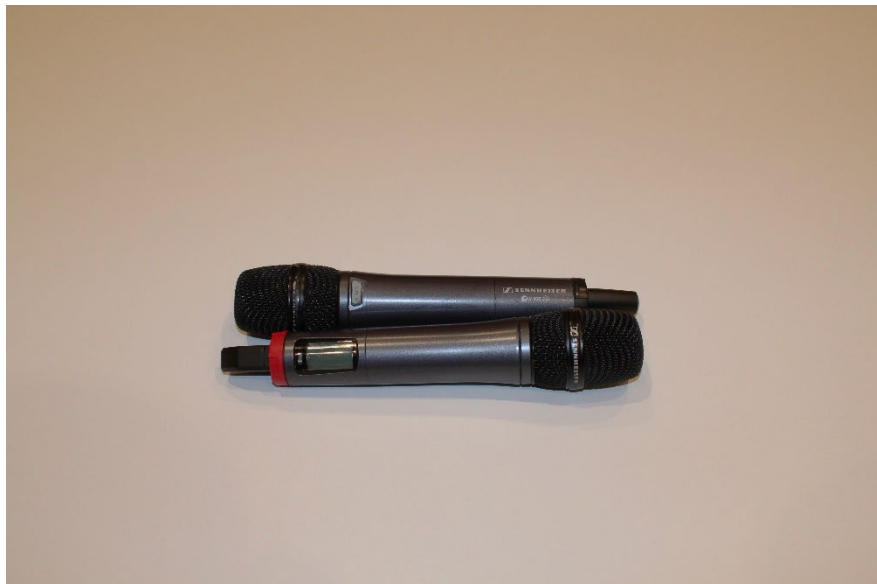
Micro sans fil